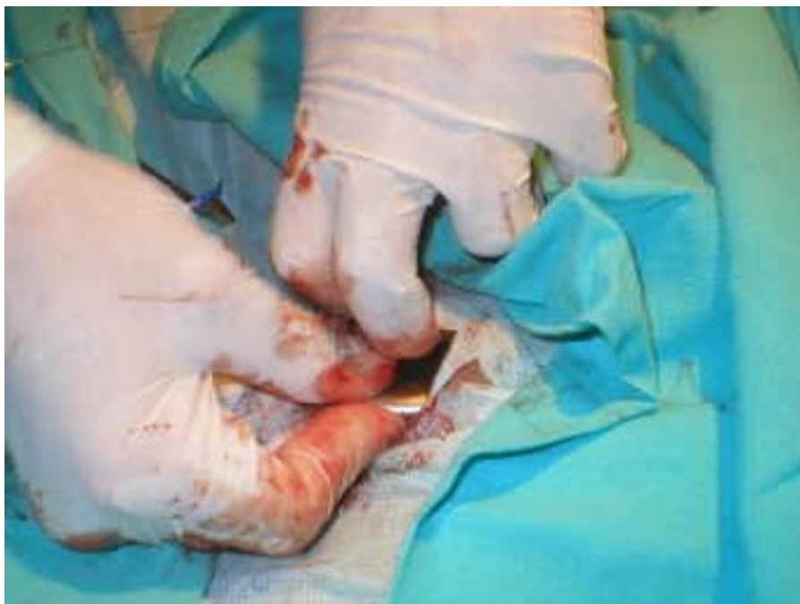
Colocación del marcapasos en el bolsillo sub-conjuntival de la tabla del cuello.