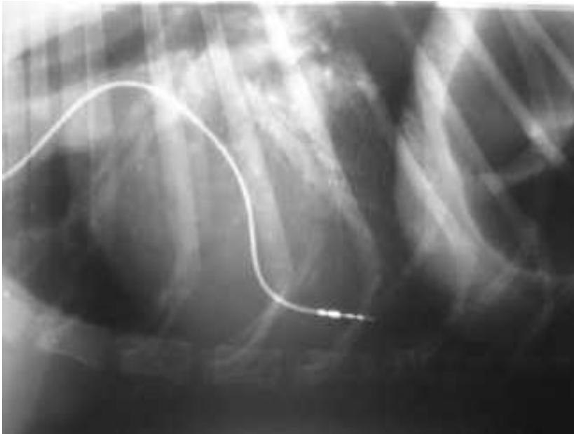
Rx LL en la que se observa el catéter y la implantación al ventrículo derecho.