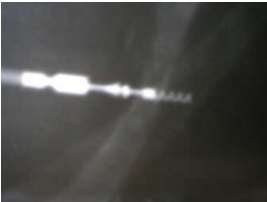
Detalle de la inserción del catéter en el miocardio ventricular.