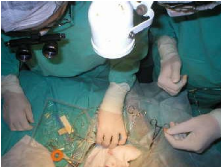
Colocación del catéter transvenoso

A tres meses de la implantación la misma es exitosa, y el paciente presenta una notable mejoría en lo que respecta a signos (nunca mas se desmayo) y aumento su capacidad física y sus deseos de juego.