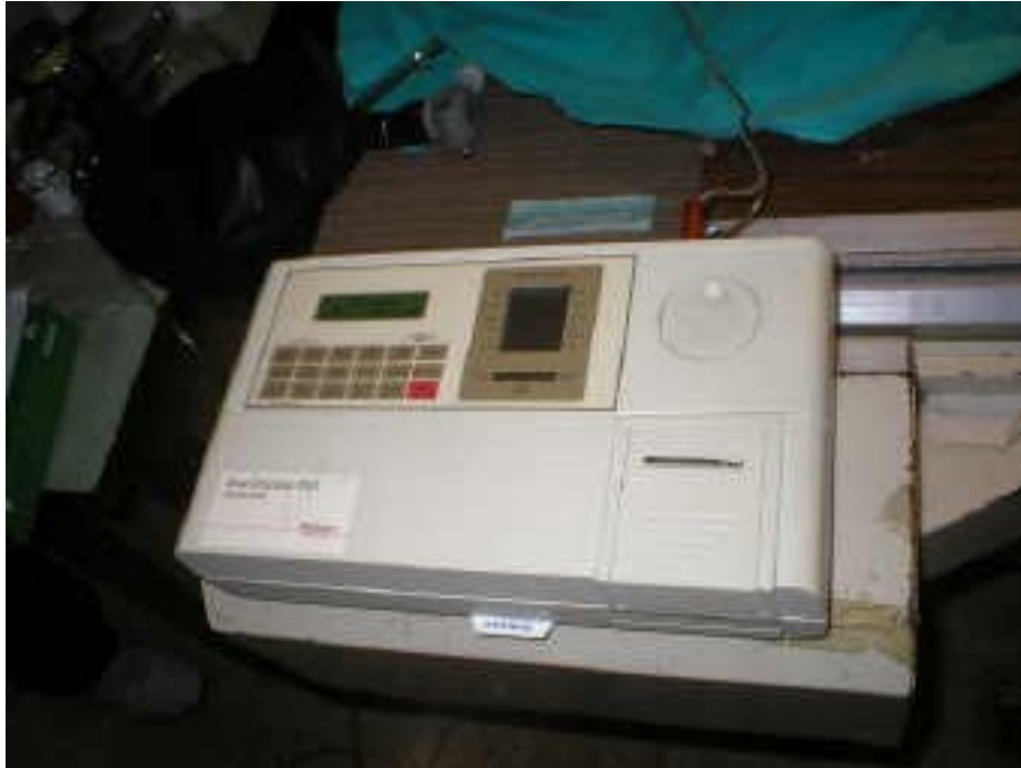
Programador del marcapasos y detección del sensado del mismo.